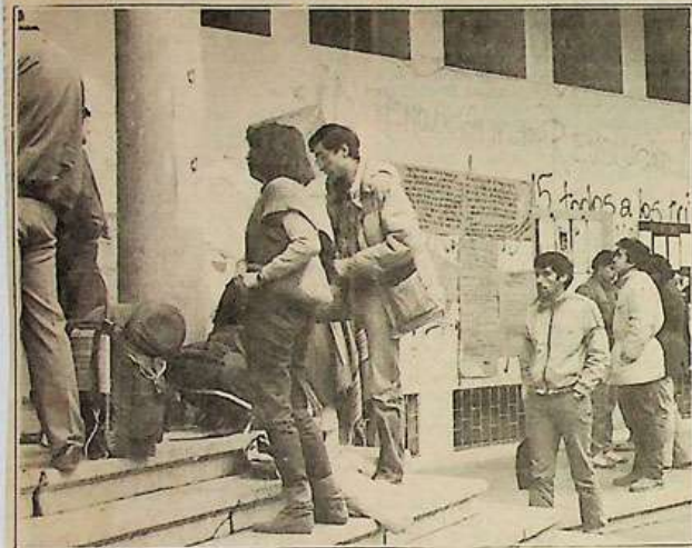
Elecciones universitarias: un escenario que depara sorpresas.

P REVISTO en todas sus partes, el desenlace de la segunda vuelta electoral por el control de la Federación de Estudiantes de la Universidad Austral, en Valdivia, puso no obstante un final de novedades a la ronda anual de renovación de las dirigencias estudiantiles en los planteles nacionales de la educación superior. A diferencia de lo ocurrido en algunas de las grandes universidades del país (como la Chile y la USACH), donde la hegemonía del centro político fue desafiada preferentemente por la izquierda, la situación de la Universidad Austral libró la suerte de la segunda vuelta a la disputa entre la misma izquierda y... una derecha que estrenó este año un importante poderío electoral en varias regiones.